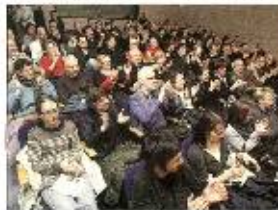
Le concert de la résidence de création 2011 à la bibliothèque Pompidou.